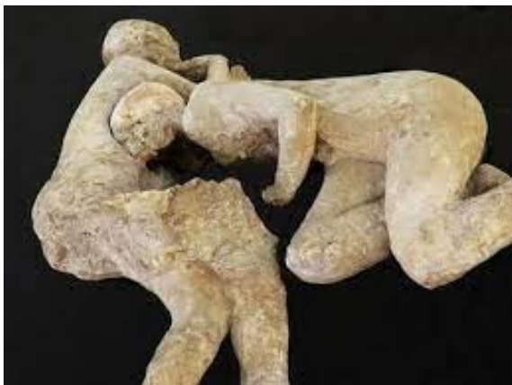
Les amants de Pompéi.