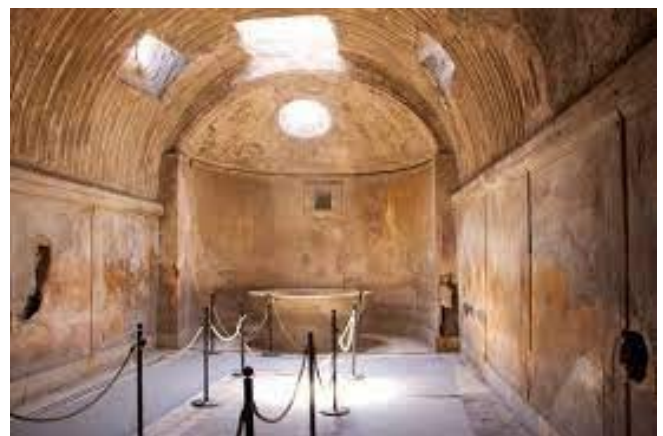
Les thermes de Pompéi