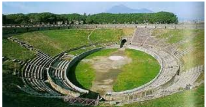
Amphitéâtre de Pompéi