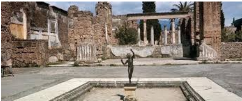
La maison du faune : Elle est nommée ainsi car en son centre se situe une statue de faune dansant .

Située à environ 242 km de Rome soit 2h30 de route en voiture, cette ville touristique saura vous charmer avec ses multiples sites archéologiques et son volcan, le Vésuve . Un véritable musée à ciel ouvert vous attend pour faire un incroyable voyage dans le temps. Cette ville endormie depuis 79 après J-C renferme en son sein une multitude de secrets bien enfouis . Venez donc les découvrir !